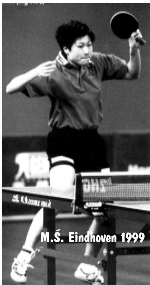
M.S. Eindhoven 1999